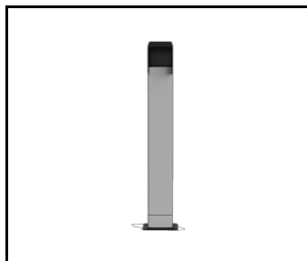
Pied pour chargeur LENERGIZEE gris, noir RAL7047/9005 mat (424045)