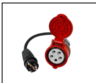
Adaptateur d'alimentation - réduction de la prise 32A 5P. IP44, à la prise 230V (16001976)

Date de création de la carte: 24 juin 2024