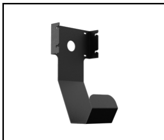
Suspension de câble LENERGIZEE RAL9005 (424281)