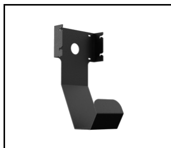
Suspension de câble LENERGIZEE RAL9005 (424281)