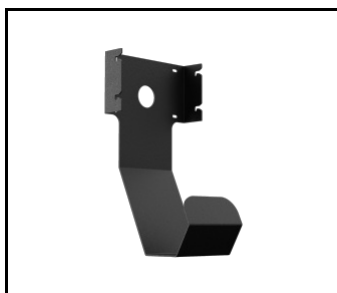
Suspension de câble LENERGIZEE RAL9005 (424281)