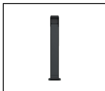
Pied pour chargeur LENERGIZEE graphite. noir RAL7016/9005 mat + TERMINAL BOX (424038)