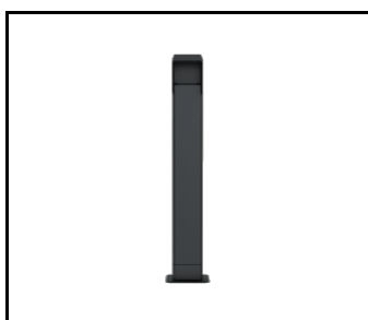
Pied pour chargeur LENERGIZEE graphite. noir RAL7016/9005 mat (424021)